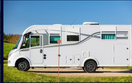
VITRES ET VOILETS ÉLECTRIQUES BREVET NOTIN